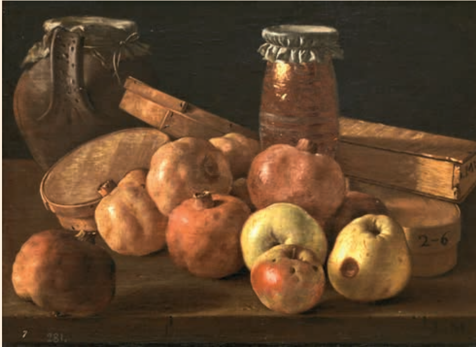
Granadas en el Museo del Prado.

Luis Egidio Meléndez, Bodegón con granadas y manzanas, cajas de dulces y otros recipientes .