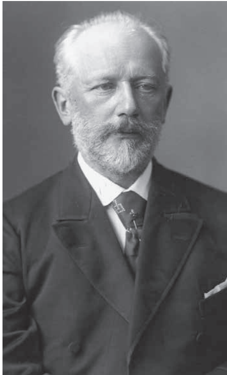
Piotr Ilich Chaikovski