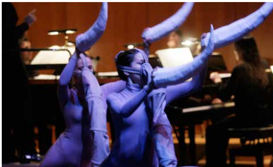
El carnaval de los animales (OCG y Conservatorio Profesional de Danza «Reina Sofía» de Granada), noviembre 2010.

y director de orquesta. La escribió en muy poco tiempo como una broma para un día de carnaval; por eso está llena de pinceladas de humor que se pueden observar, por ejemplo, cuando ridiculiza a los pianistas poniéndolos dentro de esta fauna animal como torpes estudiantes de piano, cuando hace bailar a unas lentas tortugas un baile tan animado como el can-can, o cuando disfraza a los críticos musicales de la época como personajes de largas orejas, o burros. Saint-Saëns estaba preocupado de que la pieza fuera demasiado frívola y pudiera ser perjudicial para su reputación como compositor serio; por eso prohibió que se editara mientras él viviera, excepto el movimiento de El cisne , que fue adaptado