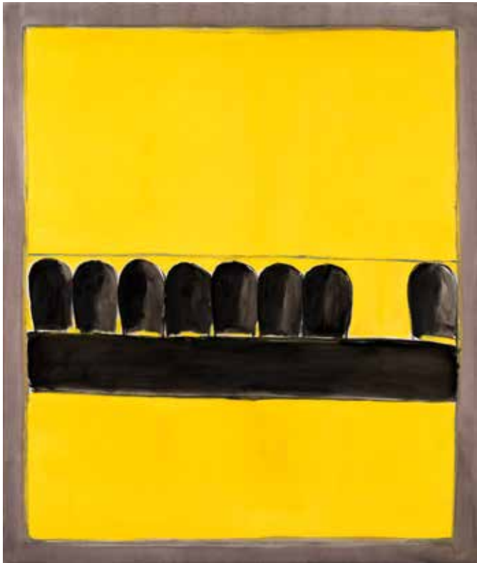
José Guerrero. Solitarios . 1971, óleo sobre lienzo, 216 x 183,5 cm Colección del Centro José Guerrero, Diputación de Granada.