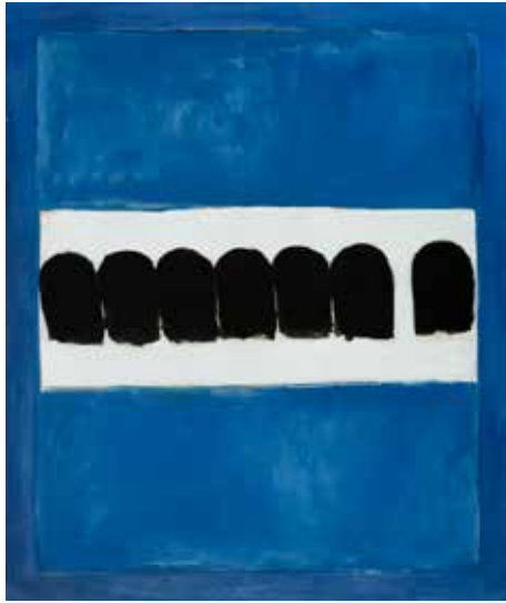
José Guerrero, Penitentes , 1972, óleo sobre lienzo, 180 x 152,5 cm Colección del Centro José Guerrero, Diputación de Granada.