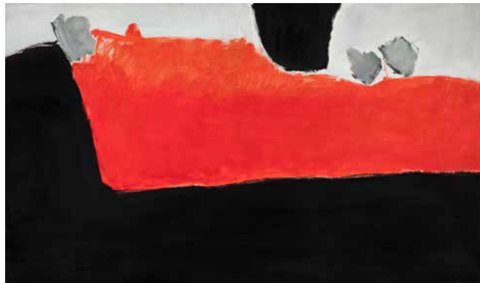
José Guerrero. Paisaje horizontal . 1969, óleo sobre lienzo, 114 x 195 cm. Colección del Centro José Guerrero, Diputación de Granada.

Para el Año Europeo de la Música de 1985, el Ministerio de Cultura de España realizó una serie de encargos a bastantes compositores sugiriéndome que empleara el mío en realizar un ballet. De acuerdo con María de Ávila, directora del Ballet Nacional de España, decidimos escoger un tema de García Lorca que trascendiera lo puramente folklórico, que no fuera argumental, y que pudiera entenderse como algo tan español como verdaderamente moderno. La elección del Llanto por la muerte de Ignacio Sánchez Mejías fue lógica ya que se trata de un magistral poema sobre la muerte con grandes resonancias metafísicas y un tratamiento que va de lo surreal a lo abstracto sin tocar apenas lo folklórico pese a tratarse de la muerte de un torero. Pero era un torero