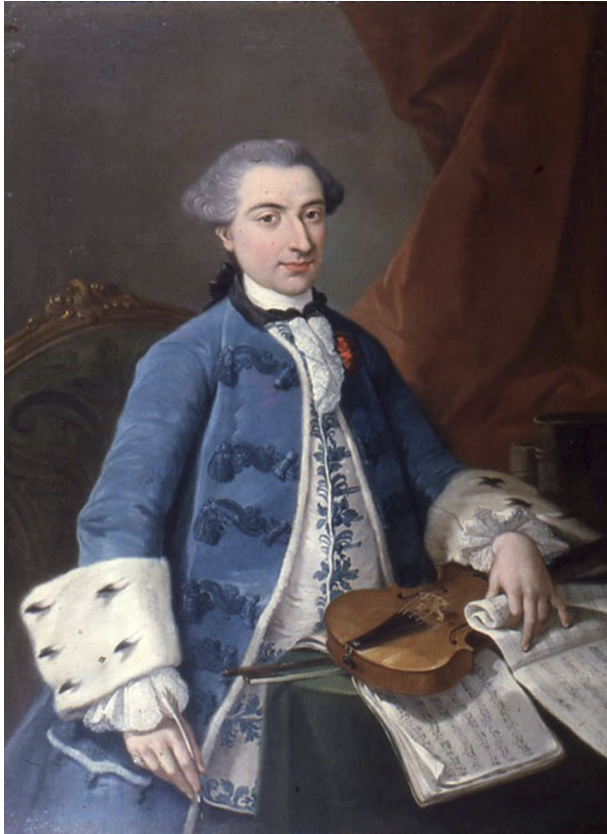
Gaetano Pugnani, en un retrato de 1754.